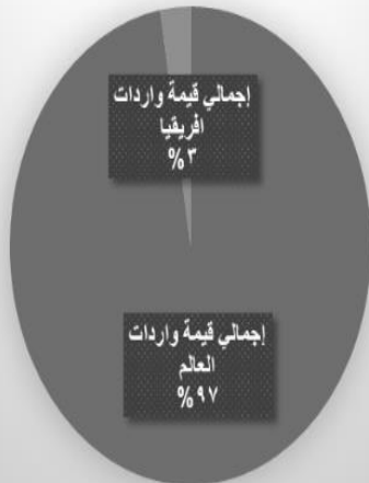
تعادل حوالي ٣٩٦,٣٨ مليار دولار من قيمة صادرات افريقيا للعالم كمتوسط فترة (٢٠٠١-٢٠١٩)

واردات العالم لنفس العام التي بلغت حوالي ١٢٦٢١,٧٠ مليار دولار، بمتوسط بلغ حوالي ٢,٦٢٪.