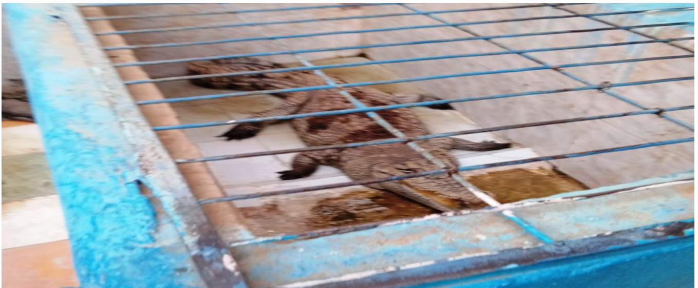
شكل رقم ( ١٨ ) تربية التماسيح داخل البيوت النوبية – صناعة تقليدية تراثية بقرية غرب سهيل

ويعرب الكثير من الزائرين لقرية غرب سهيل عن سعادتهم البالغة والكبيرة عند رؤيتهم لهذه التماسيح التي يتم تربيتها بالبيوت، وأنهم يقومون بالنقاط الصور التذكارية مع هذه التماسيح، لأنهم يجدوا متعة كبيرة عند رؤيتها وتعامل أهالي وسكان البيوت معها في شكل آمن.