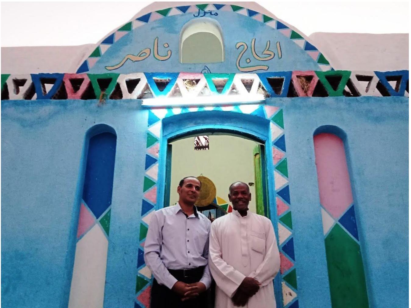
شكل رقم ( ٢١ ) الباحث أمام أحد البيوت النوبية داخل قرية غرب سهيل