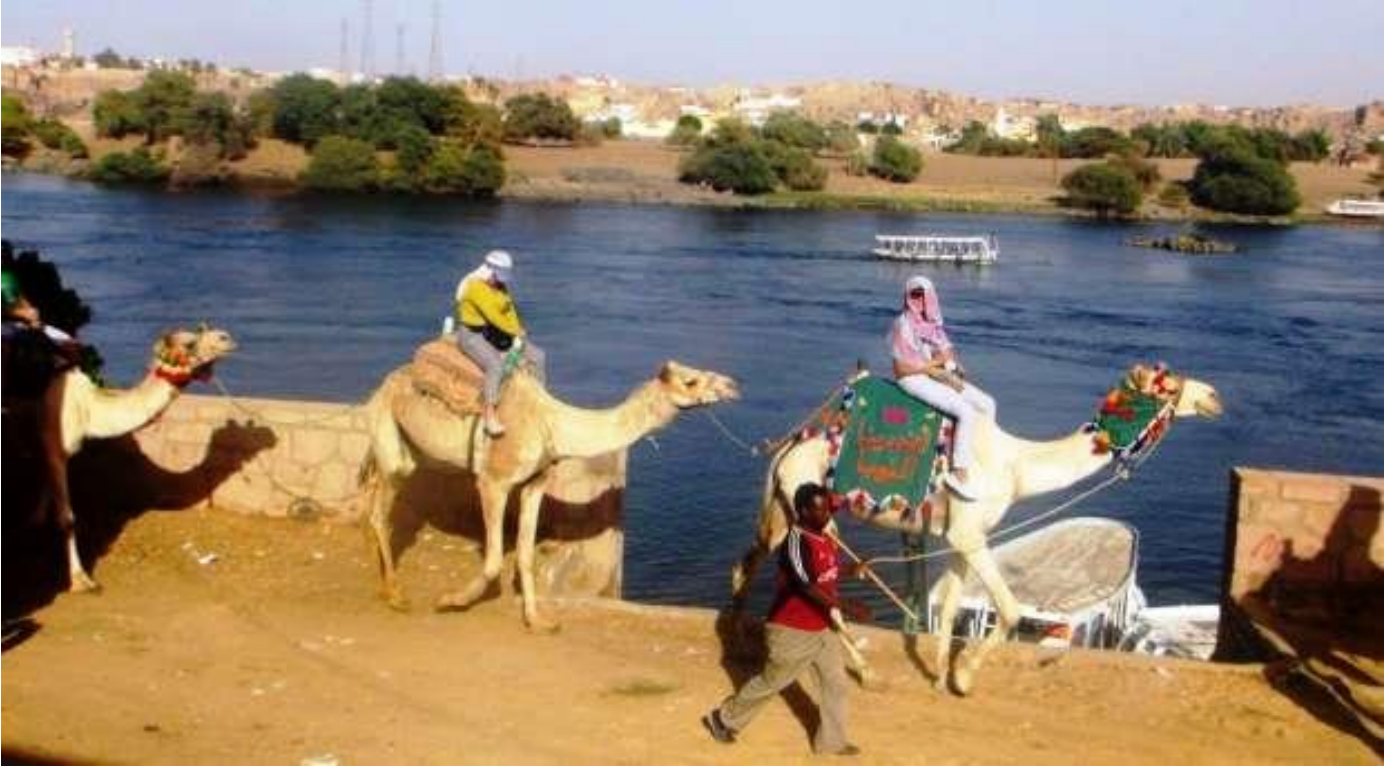
شكل رقم ( ١٢ ) رحلات " الجمال " داخل قرية غرب سهيل