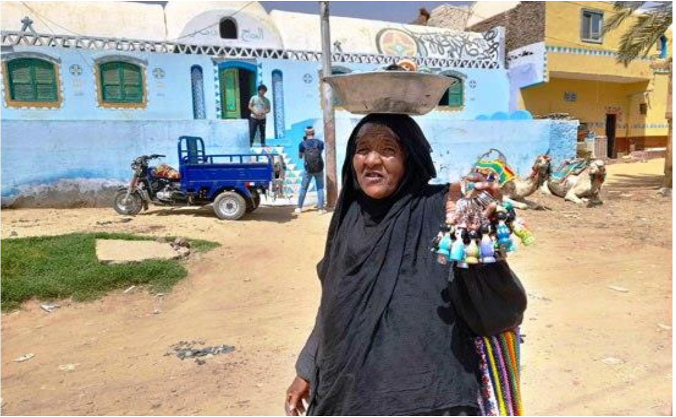
شكل رقم ( ١١ ) الصناعات التقليدية والمشغولات التقليدية للسيدات داخل قرية غرب سهيل

ويضاف لهذه الصناعات التقليدية أيضًا صناعة قديمة، وهي رحلة الجمال أو تجول السياح من فوق ظهور الجمال، فقد أشار العديد من الإخباريين بأنه تعتبر من أبرز الصناعات التقليدية أيضًا، وذلك لأنها قديمة، وتساهم في توفير مصدر رزق للشباب والرجال من أبناء قرية غرب سهيل، وهي تشهد إقبال كبير عليها من السائحين والزائرين، ومن الممكن إضافتها لنمط السياحة الثقافية في نطاق ضيق لربطها بالجمال والسنمة الواحدة وزيارة أماكن ثقافية، لكنها في النهاية نوع من السياحة البيئية والطبيعية الترفيهية.