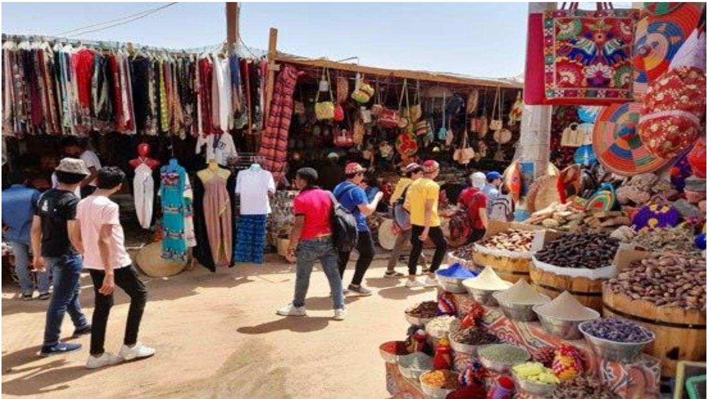
شكل رقم ( ٧ ) السائحين والزائرين يتجولون داخل قرية غرب سهيل