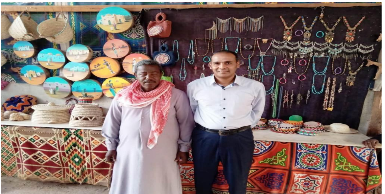
شكل رقم ( ١٠ ) الباحث مع الإخباريين داخل قرية غرب سهيل