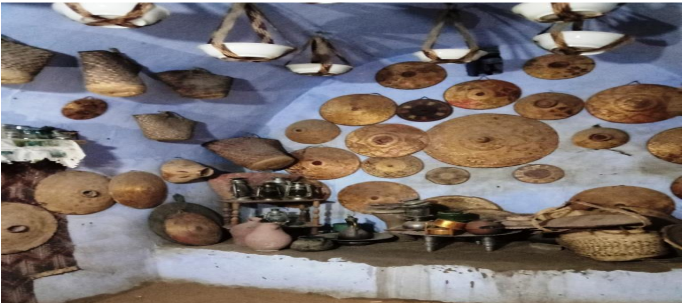
شكل رقم ( ٨ ) الصناعات التقليدية داخل قرية غرب سهيل

فيما يحرص أهالي قرية غرب سهيل للحفاظ علي هذه التراث الذي يتميز أيضًا بتواجد الصناعات التقليدية التراثية والتاريخية سواء من المشغولات اليدوية والمصنوعات المختلفة من الطاقية، والأدوات المتنوعة التي كان يستخدمها المواطن النوبي قديمًا، والمكونة والمصنعة من خوص النخيل، حيث يوجد الطبق والمشنة والشعاليق والمقطف والقلعة والفانوس والوابور وغيرها الكثير من المقتنيات التي كان يحتوي عليها المنزل النوبي منذ عهدًا طويلة، فضلًا عن الفرن النوبية البلدي التي يتم فيها إعداد العيش الشمسي المتميز. علاوة علي قيام فتيات وسيدات القرية بالحفاظ علي إحدى الصناعات التقليدية التاريخية أيضًا والمتمثلة في رسم الحناء، وهذه الصنعة أصبحت مهنة توفر مصدر دخل متميز لهن، وذلك لحرص الزائرين والسائحين من مختلف بقاع دول العالم علي رسم الحناء سواء علي الأيدي أو الأرجل أو في أي مكان بالجسم كتذكارة، لأنه يحمل الأشكال الجمالية الراقية في الرسومات الفنية بشكل ابتكاري وإبداعي منقطع النظير.