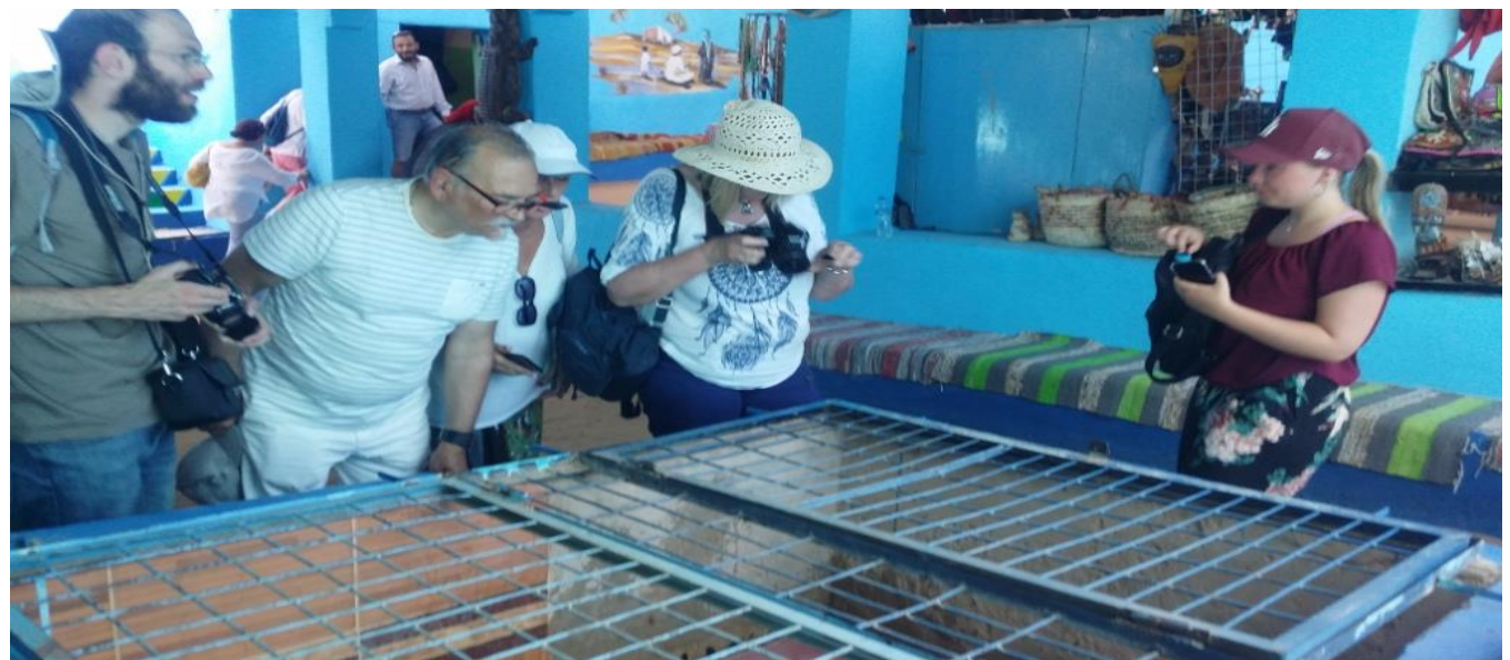
شكل رقم ( ١٩ ) السائحون يشاهدون التماسيح داخل البيوت النوبية بقرية غرب سهيل