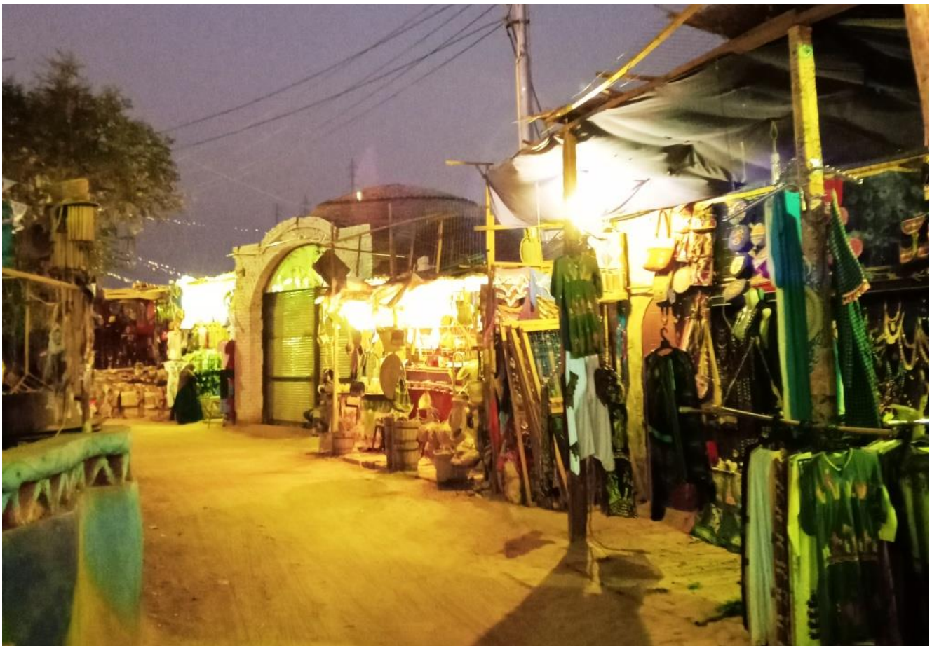
شكل رقم ( ٤ ) البازارات السياحية تضم الصناعات التقليدية داخل قرية غرب سهيل