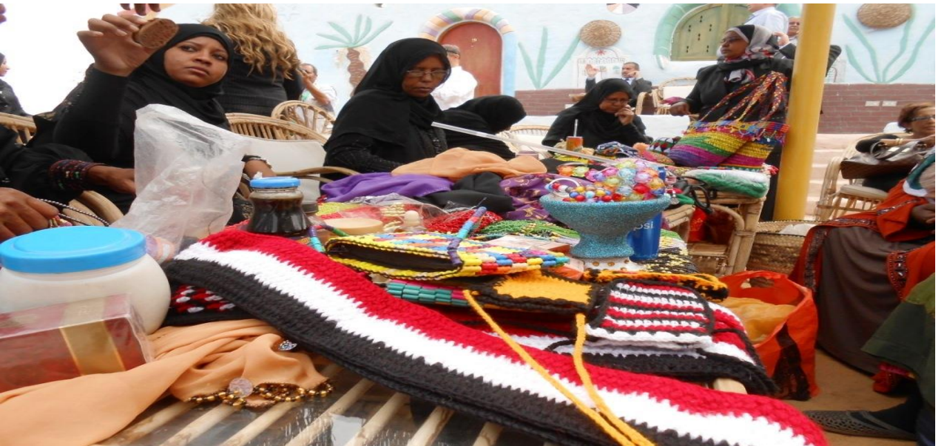
شكل رقم ( ١٦ ) صناعة المشغولات اليدوية التقليدية التراثية للسيدات بقريّة غرب سهيل

أما في وصف لتاريخ الطاقة أو الشنطة النوبية، علي سبيل المثال ضمن الصناعات التقليدية، يقول العديد من الإخباريين بأنها تعتبر من أبرز هذه الصناعات حيث يتم تصنيعها بألوان مبهجة، ويتم غزل هذه الخيوط مع بعضها لتصبح طاقة أو شنطة ذات ألوان زاهية، فطبيعة البيئة التي يعيشون بها فرضت علي سيدات المنطقة هذه المهنة، فبيئة النوبة اتاحت لهم خامات طبيعية يستثمرونها وتكون مصدر لرزقهم. فالخامات متوفرة حيث يركز فيها الاعتماد علي البيئة، فهي تعتبر من أهم الأهداف التي نسعي إلي تحقيق الاستثمار الأمثل لها.