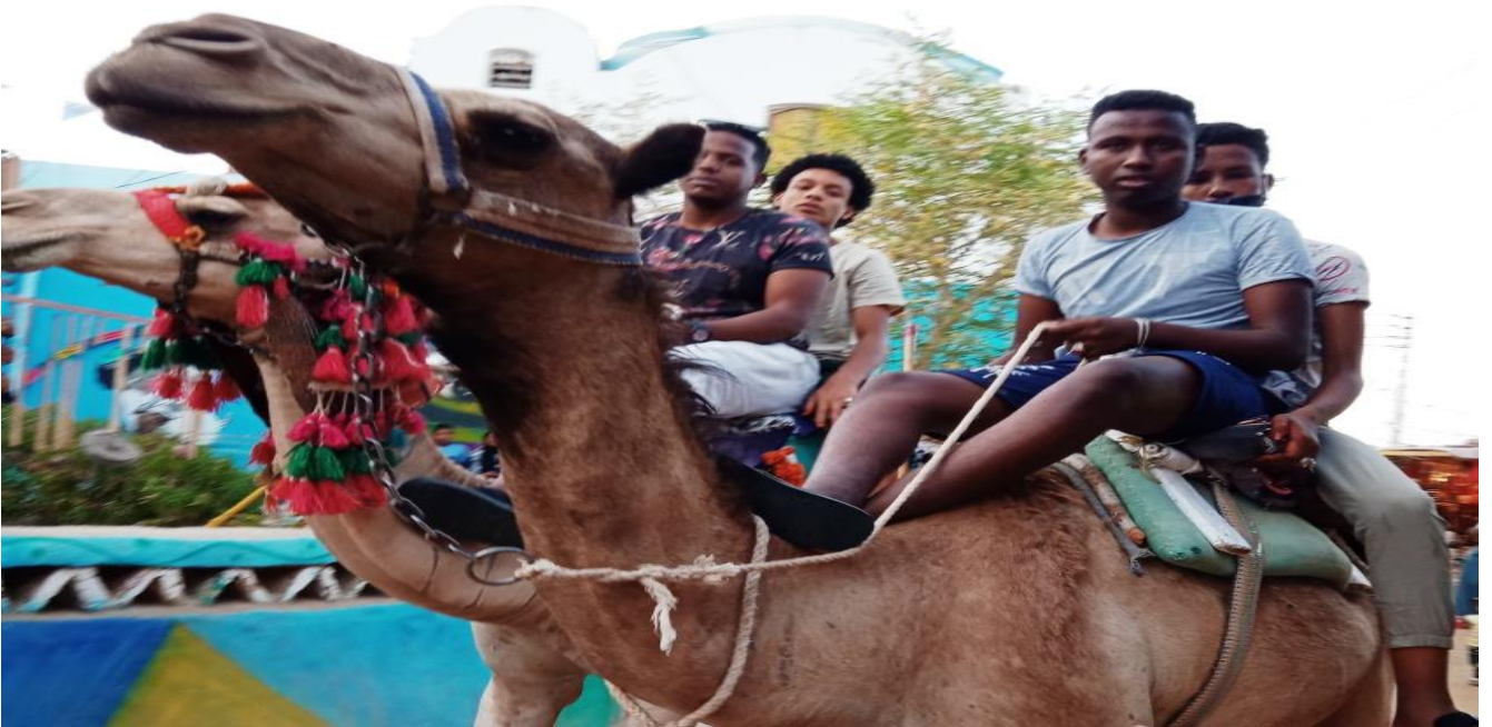
شكل رقم ( ١٣ ) رحلات " الجمال " داخل قرية غرب سهيل