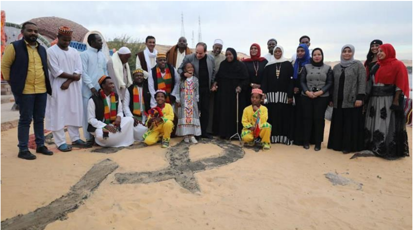
شكل رقم ( ٥ ) الرئيس عبد الفتاح السيسي أثناء زيارته لقرية غرب سهيل

وطالب الرئيس السيسي وقتذاك أيضاً، العارضات بالاهتمام بالجودة العالية لمنتجاتهم للوصول والنفوذ إلي الأسواق العالمية، وأنه قام بشراء بعض هذه المنتجات لتقديمها كهدايا لضيوف مصر. مؤكداً علي اهتمام الدولة بشكل كبير بالتراث، ولهذا فهناك اتجاه لأن تكون مدينة التراث بالعاصمة الإدارية الجديدة علي أعلى مستوى، وأن تبدأ قوية بمشاركة مجموعة من المحترفين لأن الفرصة ليست تحقيق مكسب مادي وإنما تحقيق مكسب لتاريخ مصر وإحياء تراثها.