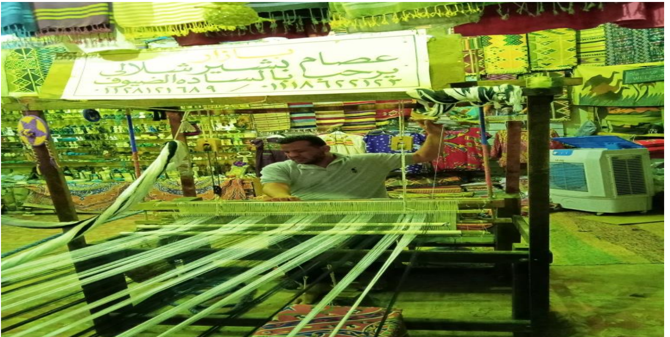
شكل رقم ( ١٤ ) صناعة " النول " من الصناعات التقليدية التراثية بقرية غرب سهيل

وأشار العاملين بصناعة النول التاريخية بأن السائحين والزائرين يشاركونهم بالتواجد بجانبهم عندما يقومون بزيارة قرية غرب سهيل حيث يشاهدونهم أثناء التصنيع لمنتجات النول، وسط تشجيع وإشادة بهذا العمل المتميز، لأن الشال اليدوي عليه إقبال من الكثيرين الذين يقدرون هذه الصناعة ذات التقنيات والإبداعات المختلفة، وخاصة شال البوب لألوانه المتنوعة والفائقة الجمال.