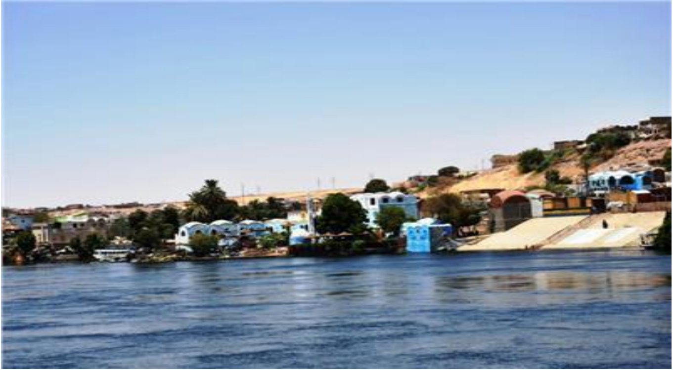
شكل رقم ( ٦ ) منظر عام من النيل لقرية غرب سهيل