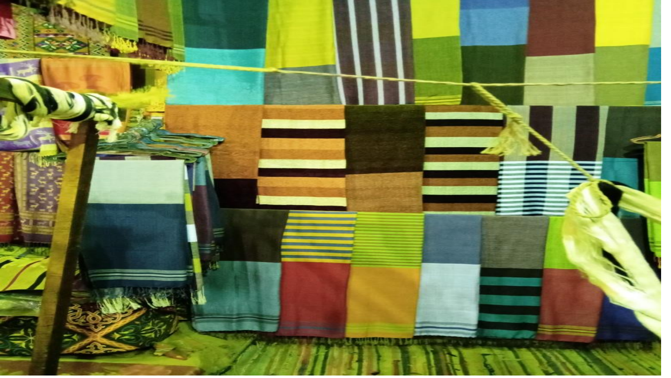
شكل رقم ( ١٥ ) منتجات صناعة " النول " التقليدية التراثية بقريّة غرب سهيل

أما في وصف لتاريخ الطاقة أو الشنطة النوبية، علي سبيل المثال ضمن الصناعات التقليدية، يقول العديد من الإخباريين بأنها تعتبر من أبرز هذه الصناعات حيث يتم تصنيعها بألوان مبهجة، ويتم غزل هذه الخيوط مع بعضها لتصبح طاقة أو شنطة ذات ألوان زاهية، فطبيعة البيئة التي يعيشون بها فرضت علي سيدات المنطقة هذه المهنة، فبيئة النوبة اتاحت لهم خامات طبيعية يستثمرونها وتكون مصدر لرزقهم. فالخامات متوفرة حيث يركز فيها الاعتماد علي البيئة، فهي تعتبر من أهم الأهداف التي نسعي إلي تحقيق الاستثمار الأمثل لها.