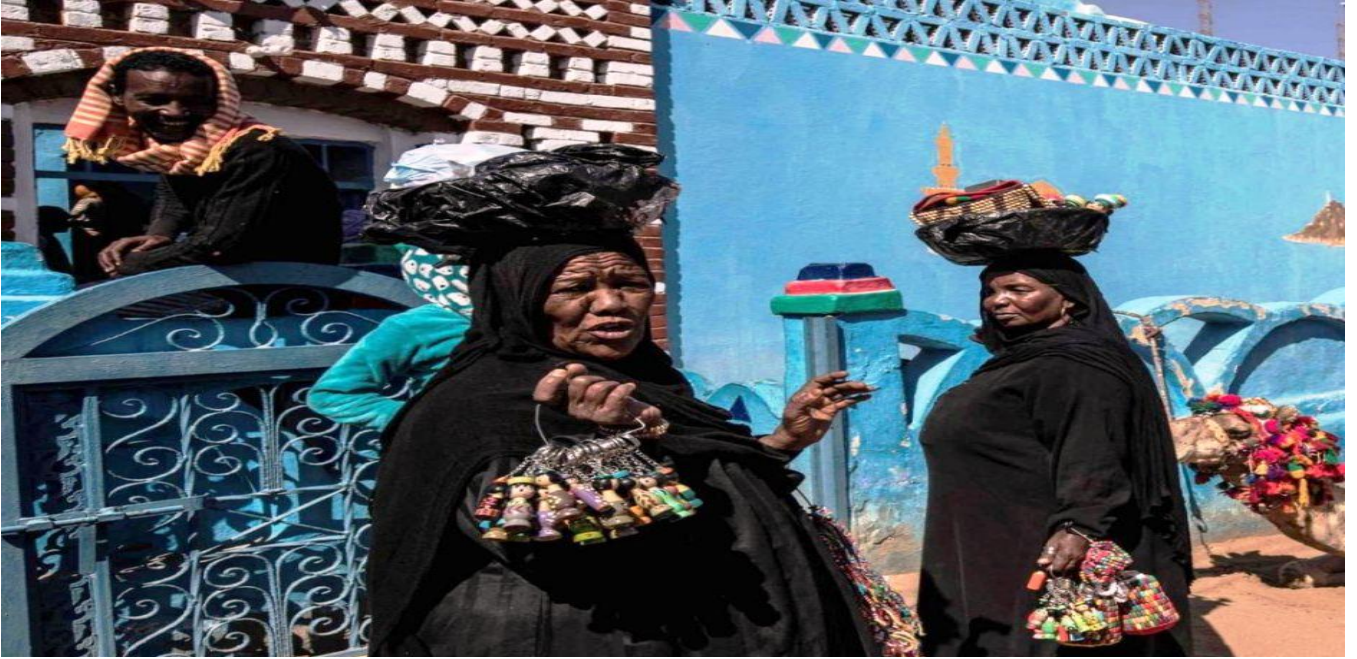
شكل رقم ( ٩ ) الصناعات التقليدية والمشغولات التقليدية للسيدات داخل قرية غرب سهيل

ولهذا فمن خلال الدراسة الميدانية لقرية غرب سهيل للتعرف علي الصناعات التقليدية بها، تم التوصل إلي أهم ما ساهم في الحفاظ علي هذه الصناعات والعمل علي تطويرها وتمييزها حتي لا تندثر. ويتضح ذلك من تحويل الأهالي لبيوتهم لتكون عبارة عن ورش ومصانع صغيرة للصناعات التقليدية من المشغولات اليدوية النوبية، وتهيئة هذه البيوت لتكون أماكن لضيافة السائحين والزائرين من خلال تحويلها للطبيعة النوبية القديمة التي كانت متواجدة منذ قرون كثيرة علي ضفاف النيل. من وجود الأحواش السماوية التي تكسوها الرمال الزاهية. فضلاً عن المأكّل والملبس والمشرب، وهذه كما يقول الإخباريين تعتبر وتمثل لدينا صناعات تقليدية وهي من خلال تصنيع "الجاكود" وهي الملوخية، وأيضاً الكابد، والسناسن التي يتم تصنيعها علي الدوكة الحديد، علاوة علي المشروبات من الأبريق والكركدية والدوم والتوابل وغيرها الكثير والكثير، حيث تعتبر هذه كلها صناعات تقليدية تراثية نعمل علي الحفاظ عليها، لأنها إرث نقوم بتوريثه لأبنائنا، فهو بحق يتوارثه الأجيال جيلاً بعد جيل.