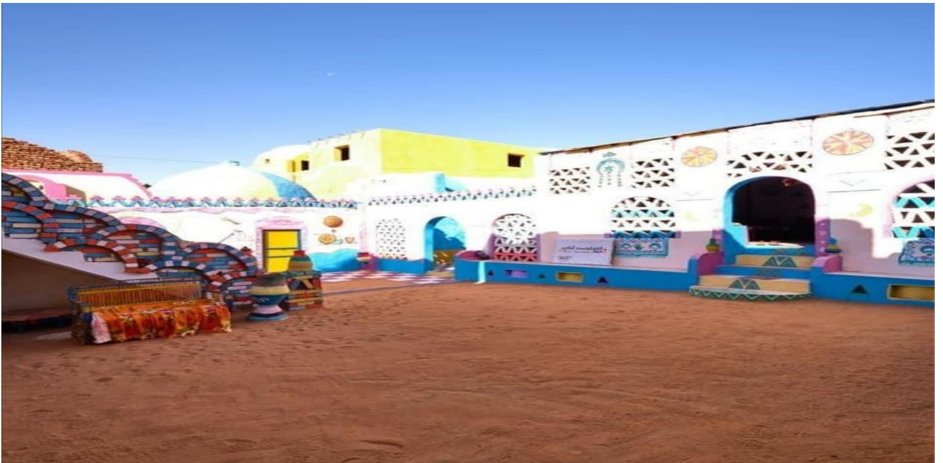
شكل رقم ( ١٧ ) البيوت النوبية داخل قرية غرب سهيل

كما أن كل من يأتي لزيارة أسوان من المسؤولين والشخصيات العامة يحرص على زيارة هذه القرية للاستمتاع بمقوماتها الجمالية والتجول بداخلها وداخل بيوتها التي تحتوي على مكونات وعناصر جمالية وحضارية منقطعة النظير من الرسومات على جدار البيوت، والقباب، والرمال في الحوش السماوي للبيت، بجانب المحتويات الأخرى من الفرن البلدي، والمطبخ النوبي المكتمل الأركان، والشاي بالنعناع، والمأكولات والمشروبات المختلفة.