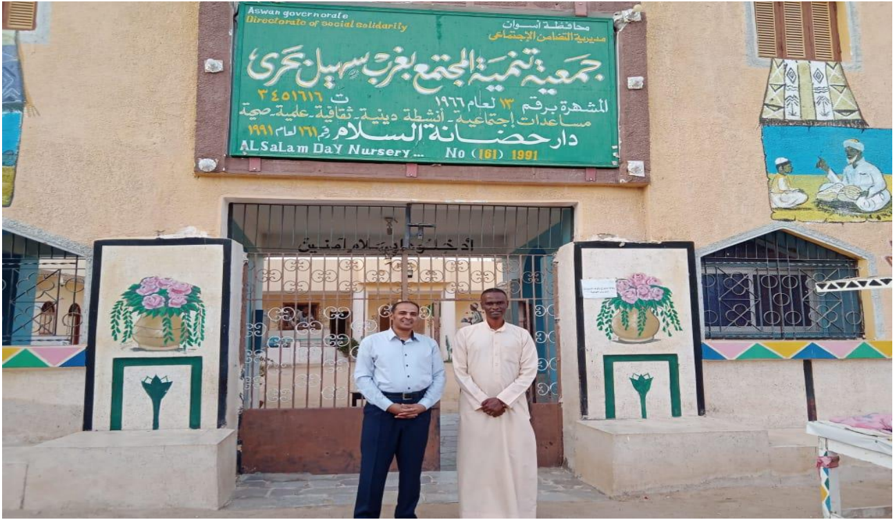
شكل رقم ( ٣ ) الباحث مع مسئول جمعية تنمية المجتمع بغرب سهيل بحري